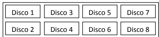
Ubicación de los discos con ampliación a 8 bahías (espacio para 8 discos, sin grabadora de DVD).

En su versión estándar, el grabador está preparado para albergar 4 discos, cuya numeración va del 5 al 8.