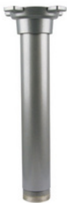
DS1651ZJ Soporte Adaptador Techo